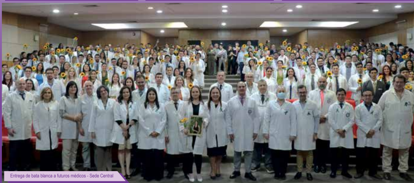
Entrega de bata blanca a futuros médicos - Sede Central