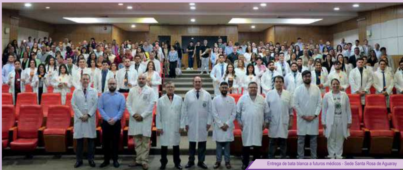
Entrega de bata blanca a futuros médicos - Sede Santa Rosa de Aguaray