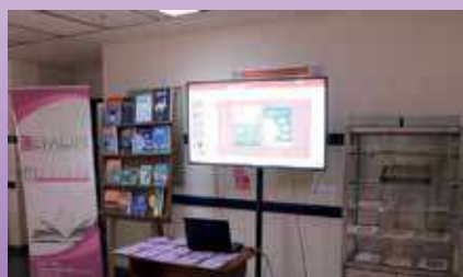
EFACIM rescata y expone la memoria de las primeras ediciones para honrar su legado