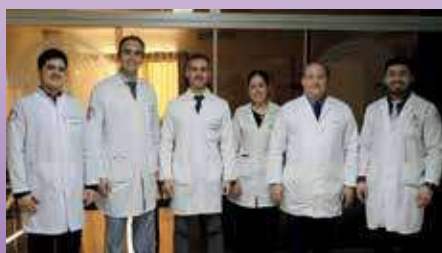
Especialistas realizaron su primera cirugía funcional para el tratamiento del Parkinson