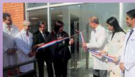
Un nuevo capítulo para la educación médica: hospital de Simulación FCM-UNA